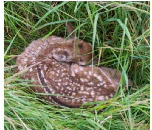
Abliegende Kitze dürfen nicht angefasst werden.

Rehe dürften viele Kinder schon mal gesehen haben. Der Unterricht kann daher an deren Erfahrungen aus Wildgehe-