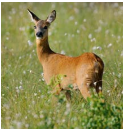
Eine Ricke mit rotbrauner Sommerdecke.

Damit es die mageren Zeiten, wenn im Winter die grüne Pflanzenäsung knapp wird, gut übersteht, muss sich ein Reh im Herbst eine dicke Feistschicht (Speck) als Reserve anlegen. Wichtig ist zudem, dass es sich energiesparend, also ungestört ruhig, verhalten kann. Bleibt die Schneedecke lange geschlossen, sorgen Jäger und Forstleute dafür, dass Rehe zusätzliches Futter bekommen.