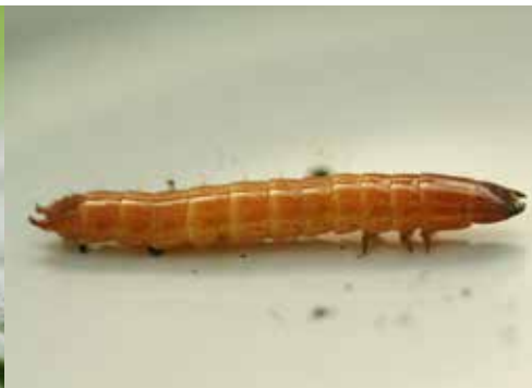
Drahtwürmer sind die Larven des Schnellkäfers und fressen tiefe Löcher in Kartoffeln.

bestimmter Kulturen. Im Gegensatz zum Hobbygarten gehört das Fangen von Schädlingen mit mechanischen Fallen nur selten dazu. Der Aufwand ist zu groß. Die Fallen dienen nur der Kontrolle auf ausgesuchten Flächen (s. links).