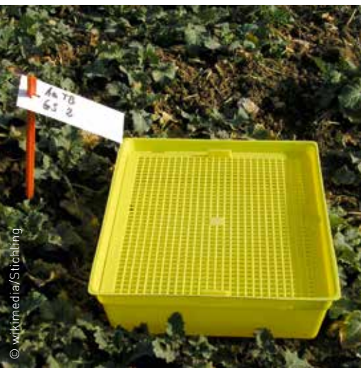
Die Beobachtung des Aufkommens von Schädlingen (und Krankheiten) – wie hier vom Kohltriebrüssler mit Gelbschalen – ist unverzichtbar für die Landwirtschaft.

Für die Planung der Maßnahmen ist es unerlässlich, dass die LandwirtInnen die Populationen der Schädlinge in ihren Kulturen beobachten. Dabei helfen z. B. Gelbschalen im Raps, Leimstreifen an Obstbäumen und Pheromonfallen für Falter/Wickler. BeraterInnen, Bücher und Apps helfen, Krankheitssymptome früh an der Pflanze zu erkennen. Für viele Schädlinge und Krankheiten gibt es Monitoringprogramme und Prognosemodelle, die deren Ausbreitung überregional untersuchen und bei Entscheidungen helfen.