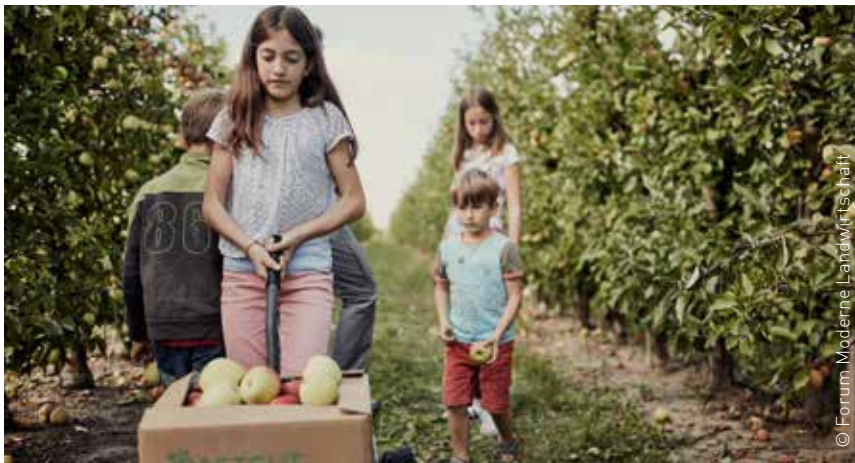
Äpfel wachsen u. a. auf Obstplantagen, wo man z. T. auch selber ernten kann.