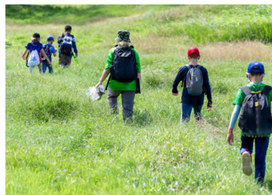
Wiesen sind Futterquelle und Erholungsgebiet zugleich.